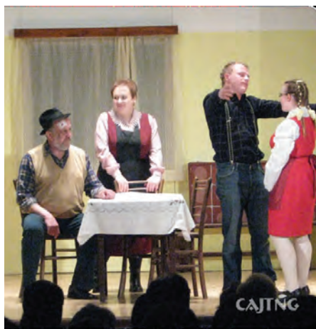
Igralci v KUD Ivana Cankarja.

veliko je tudi kmetijskih poslopij. V vasi stoji cerkev sv. Jakoba iz 18. stoletja, včasih je bilo tu še pokopališče. Tega so pozneje preselili v Šentlovrenc. V središču vasi vzdolž Temenice je kmetijska zadruga z bencinsko črpalko ter klavnico. Ob železniški progi oziroma glavni cesti so razporejeni frizerski salon, pošta, žaga, tovarna TPV, železniška postaja ter gasilski in kulturni dom.