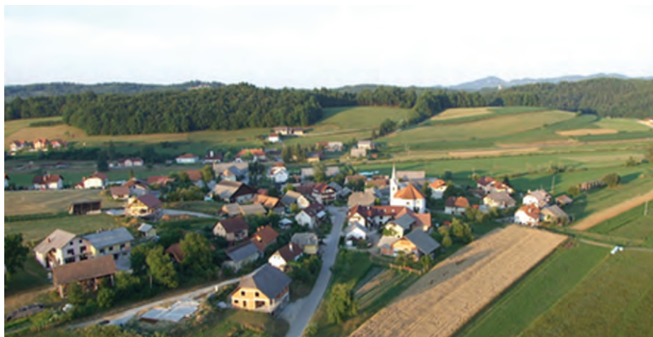
Kraj sestavlja 96 stanovanjskih hiš.