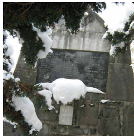
Spomenik žrtvam druge svetovne vojne.

Leta 1924 je bilo tukaj med prvimi v Sloveniji ustanovljeno društvo kmečkih fantov in deklet, s tem pa je postal naš kraj središče, iz katerega se je širila napredna miselnost na širše področje. Do leta 1955 je bil tu